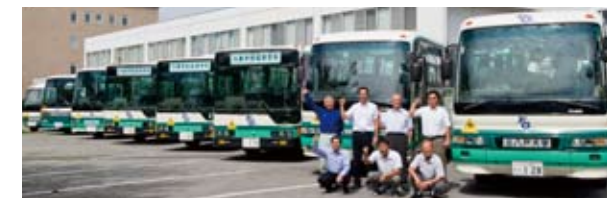
学生の通学を支えているスクールバスと運転手のみなさん

塩釜線、七戸・おいらせ線、三沢線、十和田線、十和田湖線、新郷・五戸線、川内線、南郷・市内線、階上線、二戸線、久慈線、軽米線、田子線